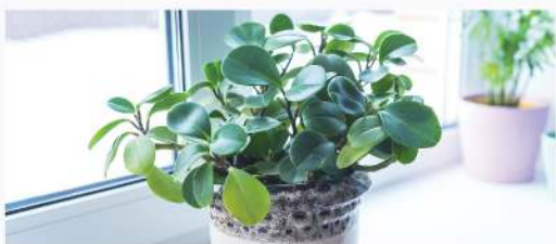
ระบบเป่าลมไล่ความชื้น

ระบบทำความสะอาดตัวเอง ล้างและเป่าแห้งคอยล์เย็นอัตโนมัติช่วยทำความสะอาดภายในคอยล์เย็น ด้วยการควบแน่นความชื้นให้กลายเป็นหยดน้ำชำระล้างสิ่งสกปรกที่สะสมอยู่ภายในเครื่อง และเป่าแห้งด้วยลมเพื่อไล่ความชื้น ให้คอยล์เย็นสะอาด ลดการสะสมของสิ่งสกปรกและกลิ่นอับ